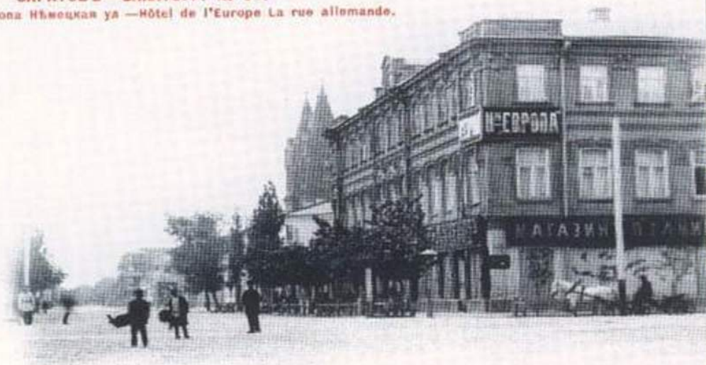
Изд. П. Г. Востужева, въ Саратовѣ.

Гостиница Европа Нѣмецкая ул —Hôtel de l'Europe La rue allemande.