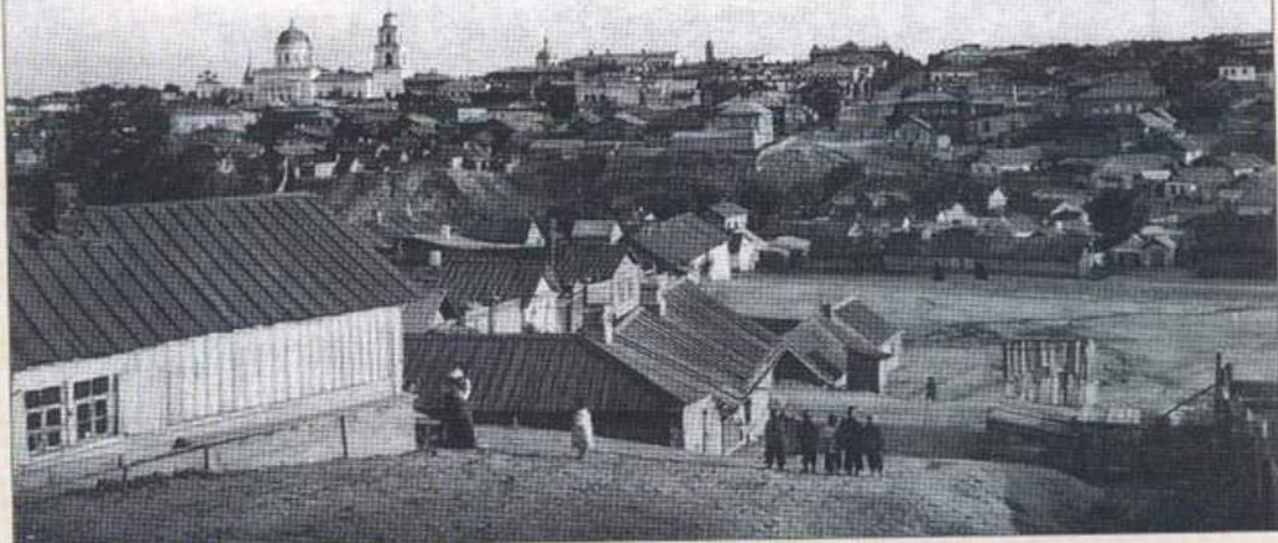
Вид города от Глебучева оврага.

Одна из достопримечательностей города – Глебов (или Глебучев) овраг. Назван в память о воеводе Саратова стольнике М.И.Глебове, который при постройке города в 1674 году на правом берегу расположил свой дом на обрыве близ Воровского (Соколовогорского) буерака.