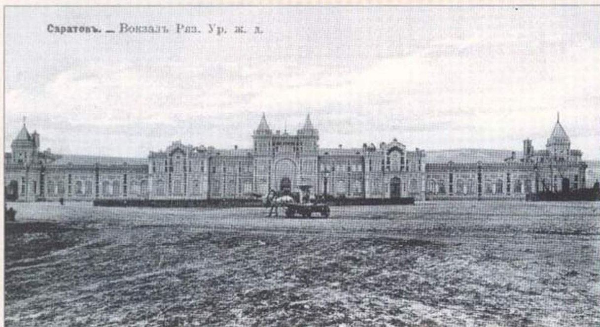
Саратов. Вокзал Рязано-Уральской железной дороги.

Здание построено в 1879 году. Реконструировано архитектором П.М.Зыбиным в 1905 году. Перестроено в 1977 году.