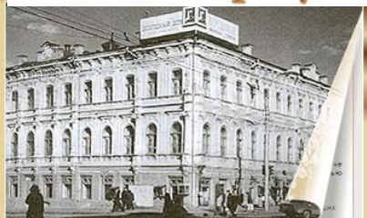
Саратовское Суворовское военное училище. 1944-1960