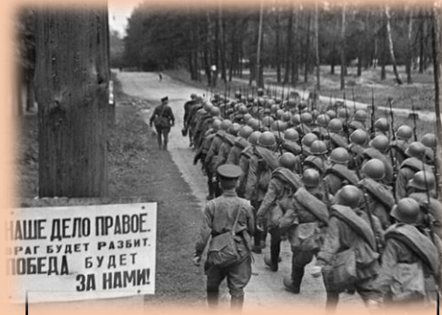
Все сражались до последнего

Тогда все шли на фронт, чтобы защитить свою страну, чтобы дать светлое будущее новым поколениям. Это были люди очень сильного духа. Даже когда враг брал их в плен и пытал, они не падали духом и не раскрывали военные тайны. Они даже умирали телом, но не духом. И к счастью мы выиграли эту войну.