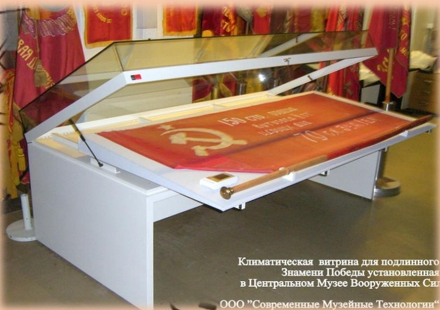
Климатическая витрина для подлинного Знамени Победы установленная в Центральном Музее Вооружённых Сил ООО "Современные Музейные Технологии"