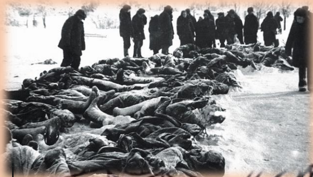
Были убиты тысячи невинных людей

Моё поколение не видело войны, но знает о ней из фильмов, прочитанных книг, рассказов ветеранов. И выслушав многие истории того времени хочется спросить: «Неужели это было на