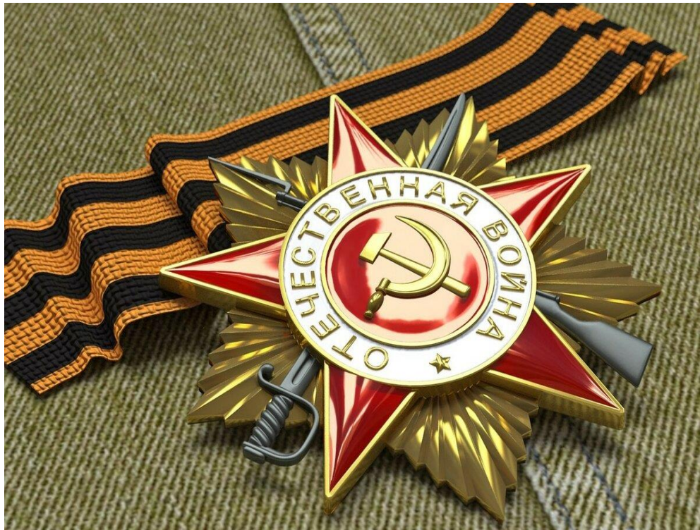
Великая Отечественная война продолжалась с 22 июня 1941 по 9 мая 1945 года.

Аристотель – древнегреческий философ. Родился в 384 г. до н.э. С 343 года до н.э. по 340 год до н.э. был воспитателем выдающегося полководца Александра Македонского. Труды Аристотеля значительно повлияли на развитие многих современных наук и научное мышление всего западного мира в целом. Самые известные его труды – «Политика», «Метафизика», «Поэтика», «Физика». Он занимался также анатомией и зоологией, философией искусства и теорией поэзии. Аристотелю принадлежит высказывание «Мудрость – это самая точная из наук». Он же является основоположником формальной логики.