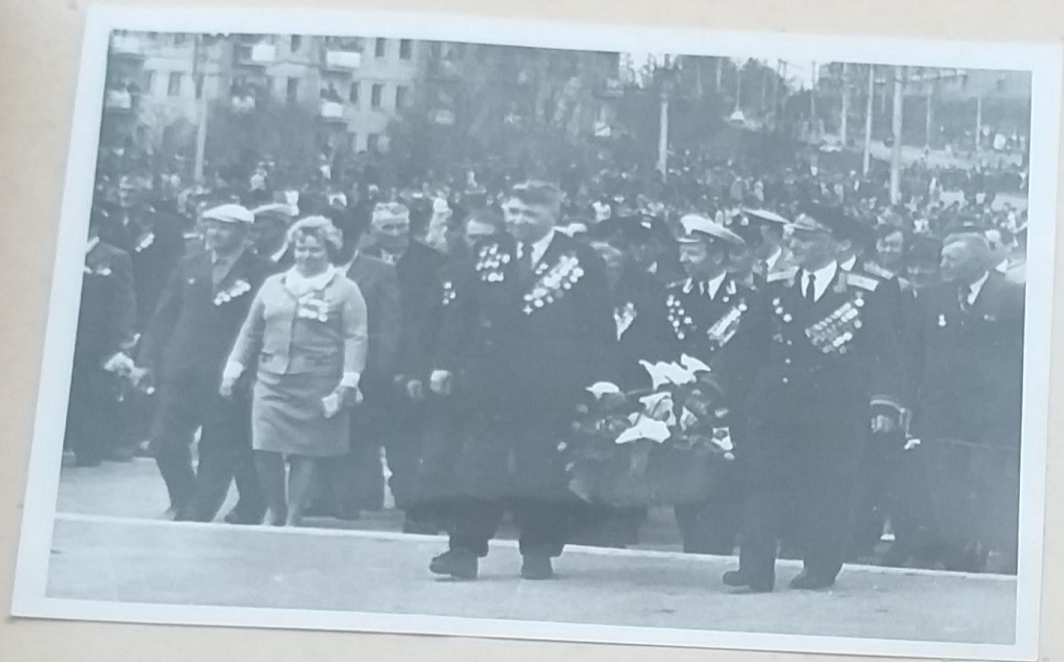
Парад, посвящённый дню Победы.