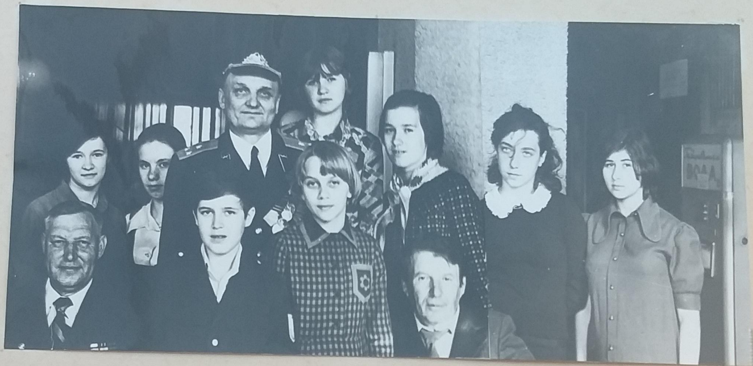
Содружество красных следопытов ср.шк.№100 г.Саратова и ср.шк.№8 г.Пензы.